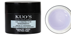
Gel Constructor Transparente Premium LED/UV

Construcción Sencilla y Duradera. GEL PREMIUM.