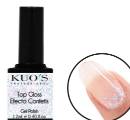
Top Gloss Efecto Confetis

Finalizador Brillo con efectos decorativos sin capa de dispersión para: Gel Polish, Base Struktur, Gel Uv o Premium, Acrílico y Pol&Gel Kuo's. MODO DE EMPLEO: Después de haber aplicado el sistema de uñas elegido, aplicar una capa del producto evitando tocar las cutículas. Secar en lámpara (UV-2'), (Led/Uv-60") o (LED-45").