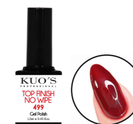
Top Finish No Wipe 499 12ml Ref. 3-499

Top finalizador S.O. de alto brillo, viscosidad media, textura fina y sin capa de dispersión para el acabado de los sistemas de uñas Gel Polish, Base Struktur, Pol&Gel, Gel y Acrílico. Aporta un acabado Gloss extra a los colores limpio, duradero y sin amarillos debido a su composición con filtros de luz. MODO DE EMPLEO: Aplicar una capa fina y uniforme del producto sobre las uñas evitando tocar la piel del contorno y secar en Lámpara Uv/Led 45" y dejar enfriar 10".