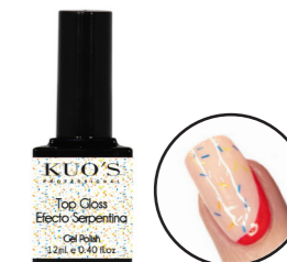
Top Gloss Efecto Serpentina

Finalizador Mate con efectos decorativos sin capa de dispersión para: Gel Polish, Base Struktur, Gel Uv o Premium, Acrílico y Pol&Gel Kuo's. MODO DE EMPLEO: Después de haber aplicado el sistema de uñas elegido, aplicar una capa del producto evitando tocar las cutículas. Secar en lámpara (UV-2'), (Led/Uv-60") o (LED-45").