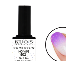
Top Multicolor No Wipe 802

Finalizador Brillo con efectos decorativos sin capa de dispersión para: Gel Polish, Base Struktur, Gel Uv o Premium, Acrílico y Pol&Gel Kuo's. MODO DE EMPLEO: Después de haber aplicado el sistema de uñas elegido, aplicar una capa del producto evitando tocar las cutículas. Secar en lámpara (UV-2'), (Led/Uv-60") o (LED-45").