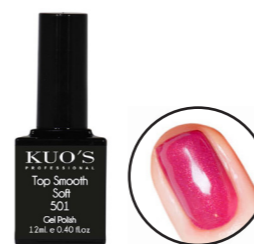
Top Smooth Soft 501 12ml Ref. 3-501

Brillo para Gel Polish de viscosidad media. Aporta un acabado a los colores limpio y duradero. No amarillea y por su composición se adapta muy bien como finalizador de la Base Flex. MODO DE EMPLEO: Después de haber aplicado el color según las indicaciones, aplicar una capa fina y uniforme del Top Smooth sobre toda la superficie de la uña sin tocar la piel del contorno. Secar en Lámpara; aprox. UV 120s, UV/LED 45s o LED 30s y repetir todo el proceso para un mejor resultado. Limpiar la capa de dispersión con Loción Limpiadora Kuo's.