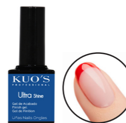
Ultra Shine 12ml Ref. 3-1097

Top flexible que ofrece un acabado de alto brillo sobre todos los colores de Gel Polish, Gel Premium, Acrílico o Pol & Gel. No tiene capa de dispersión por lo que no precisa de limpieza después del secado en lámpara. MODO DE EMPLEO: Después de haber aplicado el color según las indicaciones, aplicar una capa fina y uniforme del producto sobre toda la superficie de la uña sin tocar la piel y secar con lámpara (UV 120s, UV/LED 45s o LED 30s).