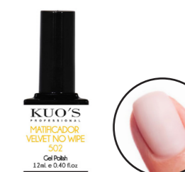
Matificador Velvet No Wipe 502 12ml Ref. 3-502

Es un finalizador con capa de dispersión que aporta un acabado efecto mate a los colores o bases, obteniendo resultados diversos como: uñas naturales, colores metalizados, efectos craks, resultados unicolor. MODO DE EMPLEO: Después de haber aplicado el color según las indicaciones, aplicar una capa fina y uniforme sobre toda la superficie de la uña sin tocar la piel del contorno. Secar en Lámpara; aprox. UV 120s, UV/LED 45s o LED 30s y repetir todo el proceso para un mejor resultado. Limpiar la capa de dispersión con Loción Limpiadora Kuo's.