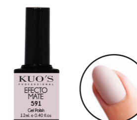
Efecto Mate 591 12ml Ref. 3-591

Gel finalizador de alto brillo para uñas de Gel o Acrílico, de viscosidad media y textura fina, sin capa de dispersión. MODO DE EMPLEO: Aplicar una capa fina y uniforme del producto sobre las uñas de gel o acrílico evitando tocar la piel del contorno y secar en Lámpara aprox. UV 120s, UV/Led 45s, Led 30s.