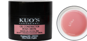
Gel Constructor Rosa Cristal Premium LED/UV

Gel monofásico blanco hielo autonivelante, de viscosidad baja y textura espesa. Permite realizar cualquier tipo de construcción en las uñas de forma sencilla y duradera. MODO DE EMPLEO: Después de poner el tip o molde y el Primer seleccionado, aplicar una capa fina del Gel y secar en lámpara; aprox. UV 120s, UV/LED 60s o LED 30s. Aplicar una segunda capa realizando la construcción y repetir el secado.