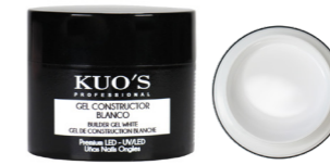
Gel Constructor Blanco Premium LED/UV

Gel monofásico autonivelante, de viscosidad baja y textura espesa. Permite realizar cualquier tipo de construcción en las uñas de forma sencilla y duradera. MODO DE EMPLEO: Después de poner el tip o molde y el Primer seleccionado, aplicar una capa fina del Gel y secar en lámpara; aprox. UV 120s, UV/LED 60s o LED 30s. Aplicar una segunda capa realizando la construcción y repetir el secado.