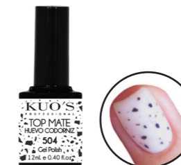
Top Mate Huevo Codorniz 504

Finalizador Brillo con efectos decorativos sin capa de dispersión para: Gel Polish, Base Struktur, Gel Uv o Premium, Acrílico y Pol&Gel Kuo's. MODO DE EMPLEO: Después de haber aplicado el sistema de uñas elegido, aplicar una capa del producto evitando tocar las cutículas. Secar en lámpara (UV-2'), (Led/Uv-60") o (LED-45").