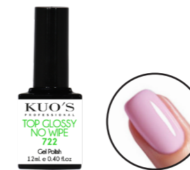
Top Glossy No Wipe 722 12ml Ref. 3-722

Brillo para Gel Polish de viscosidad media. Aporta un acabado a los colores limpio y duradero. No amarillea y por su composición se adapta muy bien como finalizador de la Base Flex. MODO DE EMPLEO: Después de haber aplicado el color según las indicaciones, aplicar una capa fina y uniforme del Top Smooth sobre toda la superficie de la uña sin tocar la piel del contorno. Secar en Lámpara; aprox. UV 120s, UV/LED 45s o LED 30s y repetir todo el proceso para un mejor resultado. Limpiar la capa de dispersión con Loción Limpiadora Kuo's.