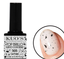
Top Brillo Huevo Codorniz 505