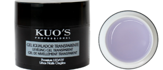
Gel Igualador Transparente Premium Premium LED/UV

Gel monofásico rosa cristal autonivelante, de viscosidad baja y textura espesa. Permite realizar cualquier tipo de construcción en las uñas de forma sencilla y duradera. MODO DE EMPLEO: Después de poner el tip o molde y el Primer seleccionado, aplicar una capa fina del Gel y secar en lámpara; aprox. UV 120s, UV/LED 60s o LED 30s. Aplicar una segunda capa realizando la construcción y repetir el secado.