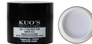
Gel Constructor White Ice Premium LED/UV

Gel monofásico rosa cover autonivelante, de viscosidad baja y textura espesa. Permite realizar cualquier tipo de construcción en las uñas de forma sencilla y duradera. MODO DE EMPLEO: Después de poner el tip o molde y el Primer seleccionado, aplicar una capa fina del Gel y secar en lámpara; aprox. UV 120s, UV/LED 60s o LED 30s. Aplicar una segunda capa realizando la construcción y repetir el secado.