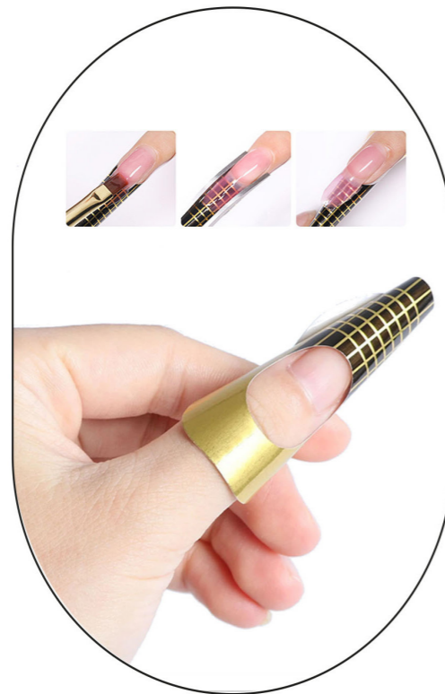
Construcción con Gel Premium -CON MOLDE