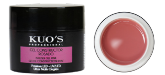
Gel Constructor Rosado Premium LED/UV

Gel monofásico blanco cover autonivelante, de viscosidad baja y textura espesa. Permite realizar cualquier tipo de construcción en las uñas de forma sencilla y duradera. MODO DE EMPLEO: Después de poner el tip o molde y el Primer seleccionado, aplicar una capa fina del Gel y secar en lámpara; aprox. UV 120s, UV/LED 60s o LED 30s. Aplicar una segunda capa realizando la construcción y repetir el secado.